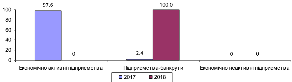
Структура заборгованості з виплати заробітної плати на 1 вересня 2017–2018 років (у % до загальної суми)

Заборгованість перед працівниками економічно активних підприємств у серпні 2018р. відсутня.