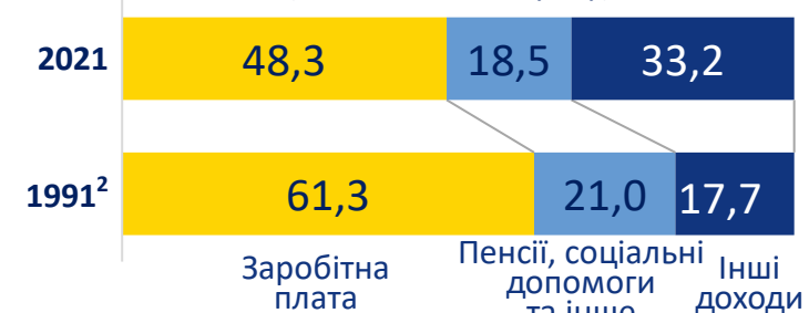
Структура сукупних ресурсів домогосподарств 1 (відсотків до підсумку)

1 За результатами обстеження умов життя домогосподарств. 2 Сукупний дохід сімей.