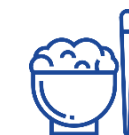
Рис ▼ -2,6