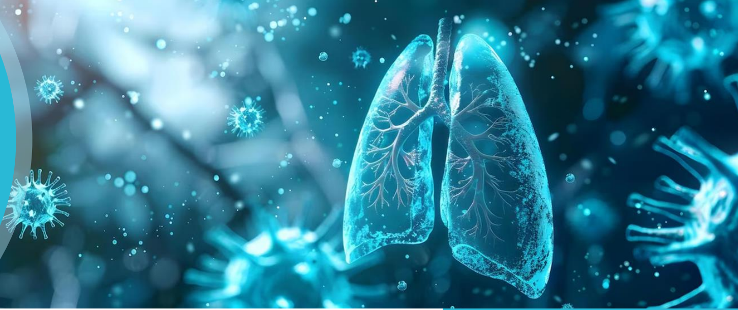
Кількість хворих 1 на активний туберкульоз (осіб)

ІНФОРМАЦІЯ НАВЕДЕНА ПО ЧЕРНІВЕЦЬКІЙ ОБЛАСТІ ЗА ДАНИМИ ДЕПАРТАМЕНТУ ОХОРОНИ ЗДОРОВ'Я ЧЕРНІВЕЦЬКОЇ ОБЛАСНОЇ ДЕРЖАВНОЇ АДМІНІСТРАЦІЇ