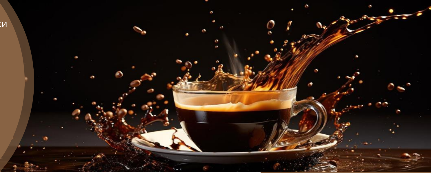
Імпорт кави у Чернівецьку область (т)

ІНФОРМАЦІЯ НАВЕДЕНА ПО ЧЕРНІВЕЦЬКІЙ ОБЛАСТІ