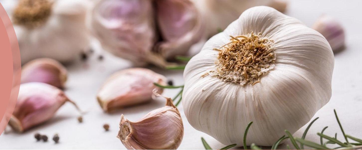
Виробництво часнику господарствами населення (тис. т)

ІНФОРМАЦІЯ НАВЕДЕНА ПО ЧЕРНІВЕЦЬКІЙ ОБЛАСТІ