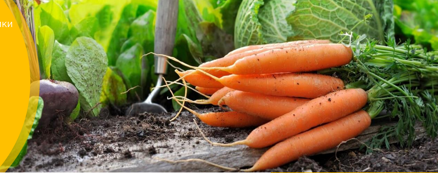
Середні споживчі ціни на моркву в Україні та Чернівецькій області, грн за кг