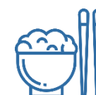
Рис ▼ -2,3%